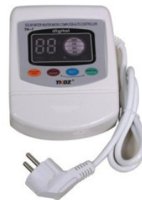
Kontroler TK-7 180,00 PLN