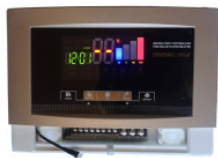
Kontroler Prophet... 180,00 PLN