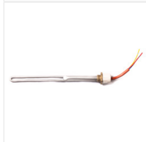
Grzałka elektrycz... 55,00 PLN