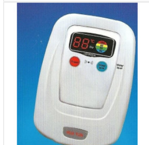
Elektroniczny ter... 65,00 PLN