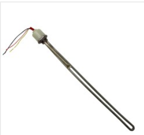
Elektroheizer 150... 55,00 PLN