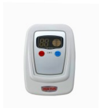
HLC-1 elektronic... 65,00 PLN