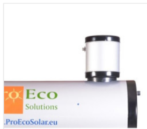
Zbiorniczek wyrów... 130,00 PLN