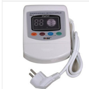
Kontroler TK-7 180,00 PLN