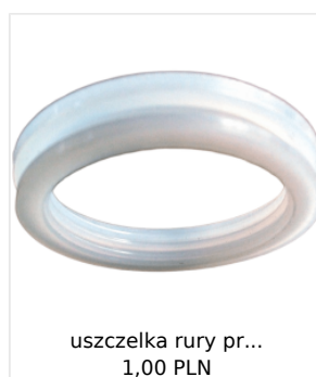
uszczelka rury pr... 1,00 PLN