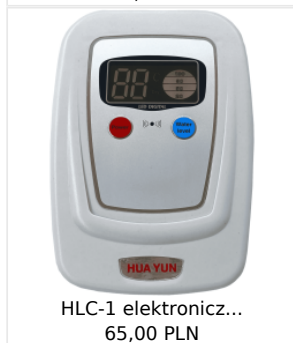
HLC-1 elektronicz... 65,00 PLN