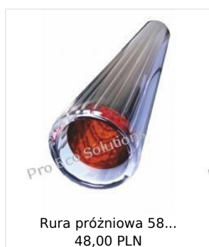
Rura próżniowa 58... 48,00 PLN