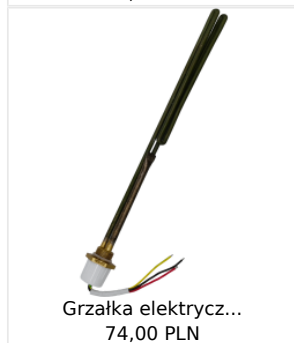
Grzałka elektrycz... 74,00 PLN