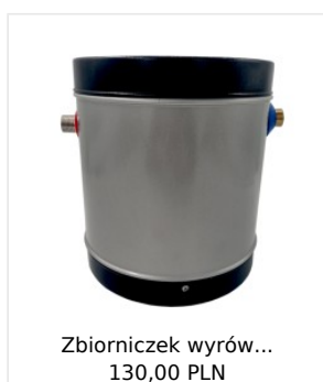
Zbiorniczek wyrów... 130,00 PLN