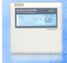
Kontroler SR81/SR... 450,00 PLN