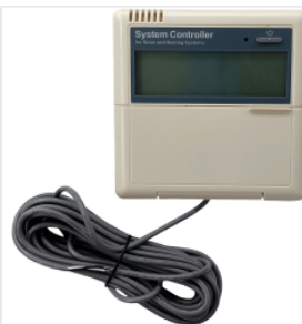
Kontroler SR81 450,00 PLN