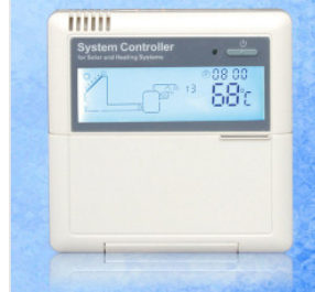
Kontroler SR81/SR... 450,00 PLN