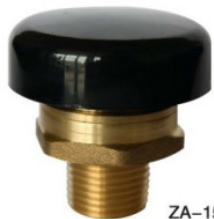
Zawór podciśnieni... 36,00 PLN