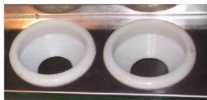
uchwyt rury próżn... 1,00 PLN