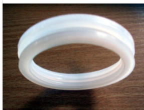
uszczelka rury pr... 1,00 PLN