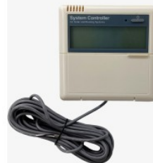
Kontroler SR81 450,00 PLN