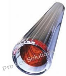
Rura próżniowa 58... 48,00 PLN