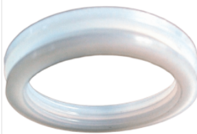
uszczelka rury pr... 1,00 PLN