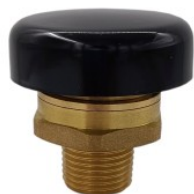
Zawór podciśnieni... 36,00 PLN