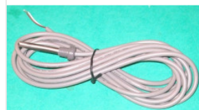
Czujnik temperatu... 25,00 PLN