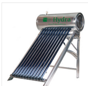
Podgrzewacz PROEC... 3 150,00 PLN