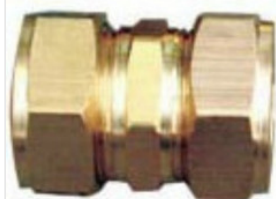
złączka skręcana ... 25,00 PLN