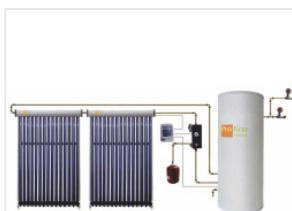
Zestaw PROECO CY-300 12 100,00 PLN