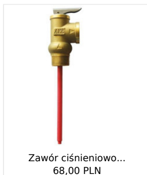
Zawór ciśnieniowo... 68,00 PLN