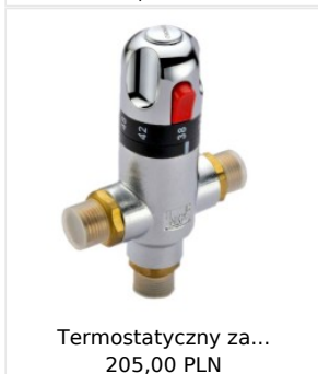
Termostatyczny za... 205,00 PLN