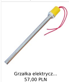
Grzałka elektrycz... 57,00 PLN