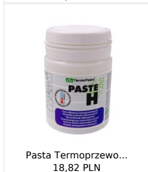
Pasta Termoprzewo... 18,82 PLN