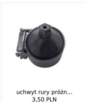
uchwyt rury próżn... 3,50 PLN