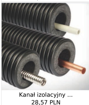
Kanał izolacyjny ... 28,57 PLN