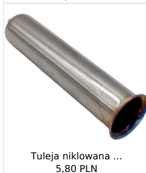
Tuleja niklowana ... 5,80 PLN