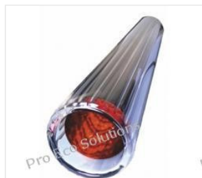
Rura próżniowa 58... 48,00 PLN