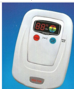
Elektroniczny ter... 65,00 PLN