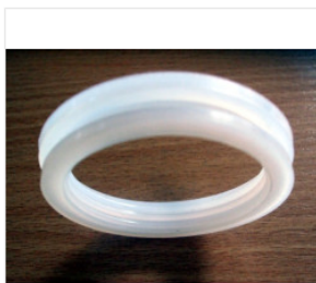
uszczelka rury pr... 1,00 PLN