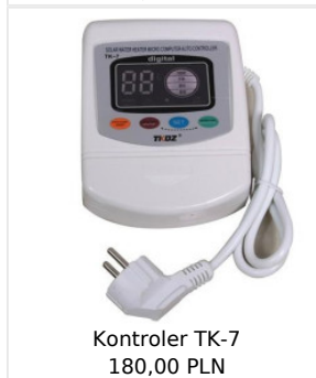
Kontroler TK-7 180,00 PLN