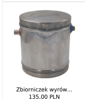
Zbiorniczek wyrów... 135,00 PLN