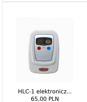
HLC-1 elektronicz... 65,00 PLN