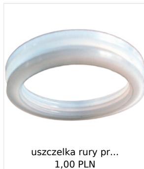
uszczelka rury pr... 1,00 PLN