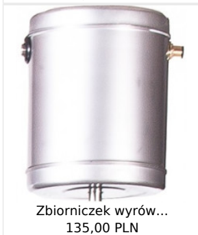
Zbiorniczek wyrów... 135,00 PLN