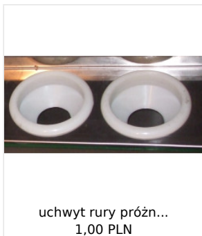
uchwyt rury próżn... 1,00 PLN