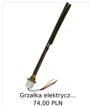
Grzałka elektrycz... 74,00 PLN