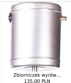
Zbiorniczek wyrów... 135,00 PLN