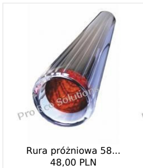
Rura próżniowa 58... 48,00 PLN