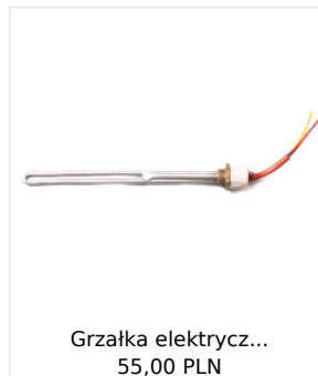
Grzałka elektrycz... 55,00 PLN