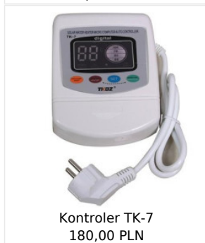
Kontroler TK-7 180,00 PLN