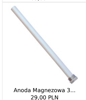
Anoda Magnezowa 3... 29,00 PLN