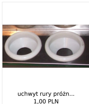
uchwyt rury próżn... 1,00 PLN