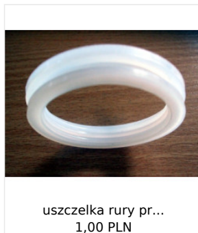
uszczelka rury pr... 1,00 PLN