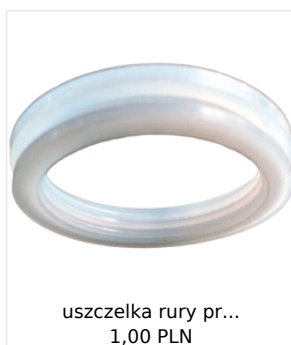
uszczelka rury pr... 1,00 PLN