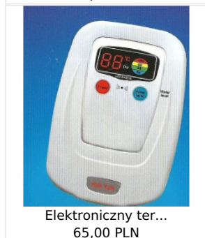
Elektroniczny ter... 65,00 PLN