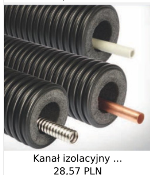
Kanał izolacyjny ... 28,57 PLN