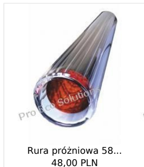
Rura próżniowa 58... 48,00 PLN