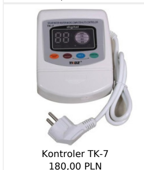
Kontroler TK-7 180,00 PLN