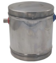
Expanzní nádrž z ... 120,00 zł