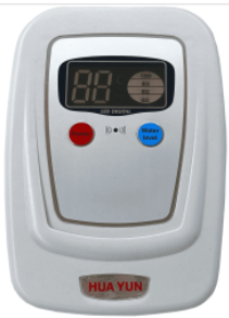
HLC-1 elektronick... 65,00 zł