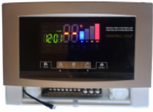
Řídicí jednotka P... 180,00 zł