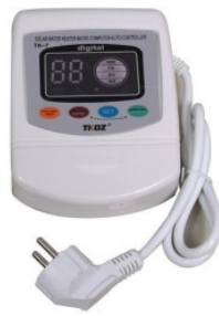
Regulátor TK-7 180,00 zł