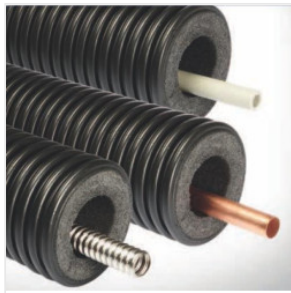
Izolační potrubí ... 28,57 zł