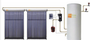
Zestaw PROECO CY-150 8 200,00 PLN