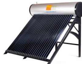
Podgrzewacz PROEC... 4 500,00 PLN