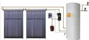
Zestaw PROECO CY-300 12 100,00 PLN