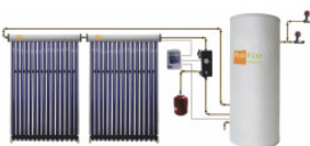
Zestaw PROECO CY-150 8 200,00 PLN