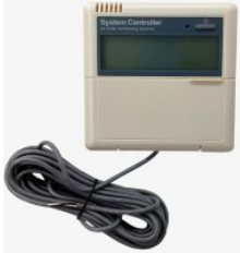
Kontroler SR81 450,00 PLN