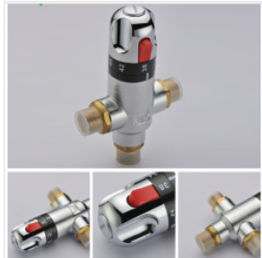
Termostatyczny za... 205,00 PLN