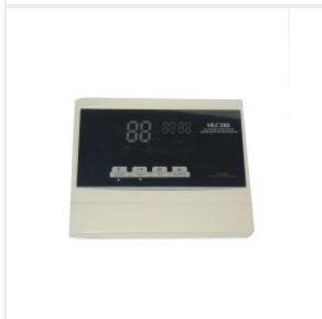
Kontroler HLC-388 175,00 PLN