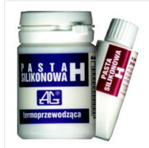
Pasta Termoprzewo... 15,82 PLN