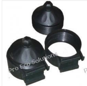
uchwyt rury próżn... 3,50 PLN