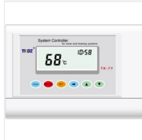
Kontroler TK-7Y 180,00 PLN