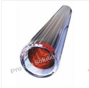
Rura próżniowa 58... 48,00 PLN