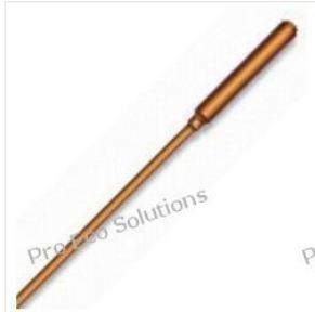
Rurka ciepła - He... 42,00 PLN