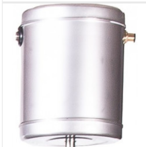
Zbiorniczek wyrów... 135,00 PLN