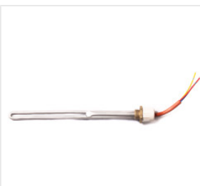
Grzałka elektrycz... 55,00 PLN