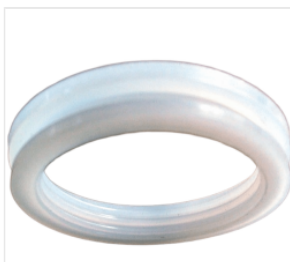
uszczelka rury pr... 1,00 PLN