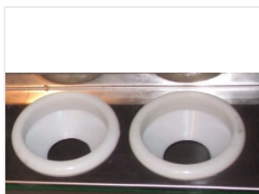
uchwyt rury próżn... 1,00 PLN