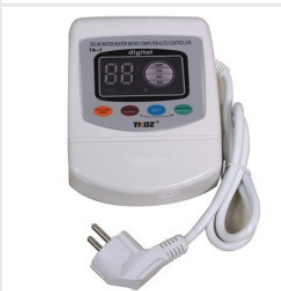
Kontroler TK-7 180,00 PLN