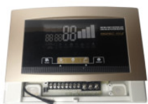
Kontroler Prophet... 180,00 PLN