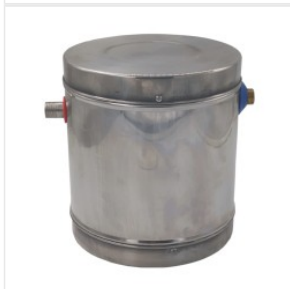
Zbiorniczek wyrów... 135,00 PLN