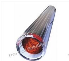
Rura próżniowa 58... 48,00 PLN