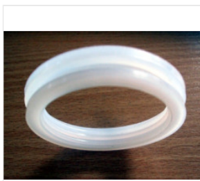
uszczelka rury pr... 1,00 PLN