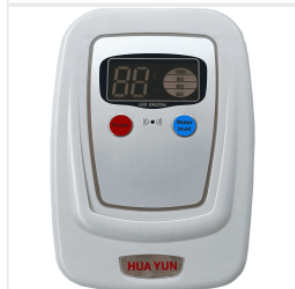
HLC-1 elektronicz... 65,00 PLN