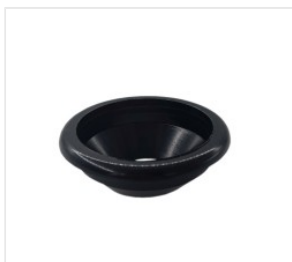
uchwyt rury próżni... 1,00 PLN