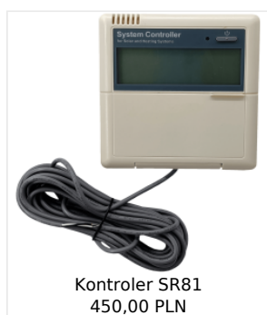
Kontroler SR81 450,00 PLN