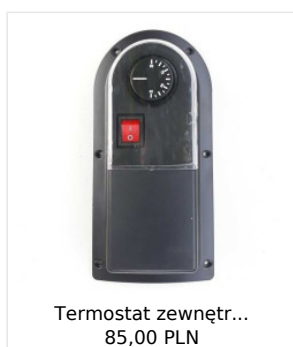
Termostat zewnętrzny... 85,00 PLN