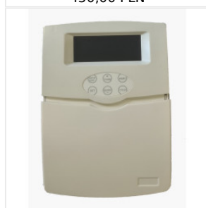
Kontroler TK-5a WiFi 250,00 PLN