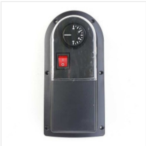
Termostato extern... 85,00 zł