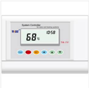
Controlador TK 7Y 180,00 zł