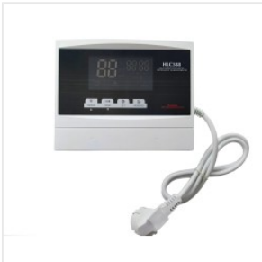
Controlador HLC 388 175,00 zł