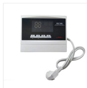
Kontroler HLC-388 175,00 PLN