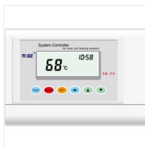
Kontroler TK-7Y 180,00 PLN