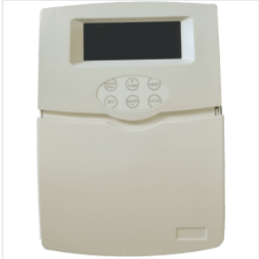
Controlador WiFi ... 199,00 zł