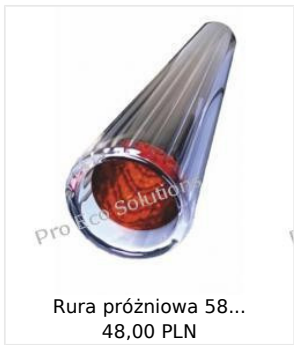
Rura próżniowa 58... 48,00 PLN