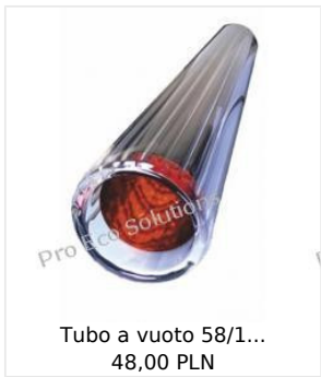
Tubo a vuoto 58/1... 48,00 PLN