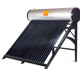
Ohřívač vody PROE... 3 600,00 zł