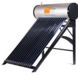
Podgrzewacz PROEC... 2 137,50 PLN