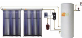
Solární systém PR... 8 200,00 zł