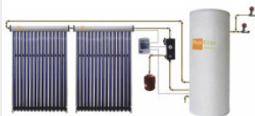
Zestaw PROECO CY-150 8 200,00 PLN