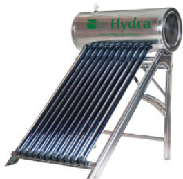
Ohřívač vody PROE... 3 150,00 zł