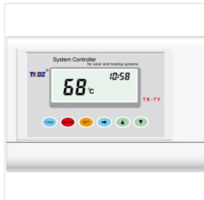
Kontroler TK-7Y 180,00 PLN