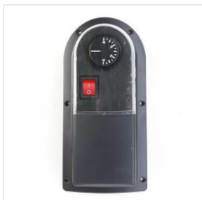
Termostat zewnętr... 85,00 PLN