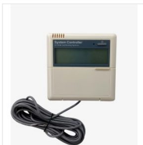
Kontroler SR81 450,00 PLN