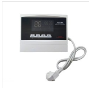
Kontroler HLC-388 175,00 PLN