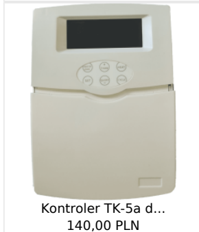
Kontroler TK-5a d... 140,00 PLN