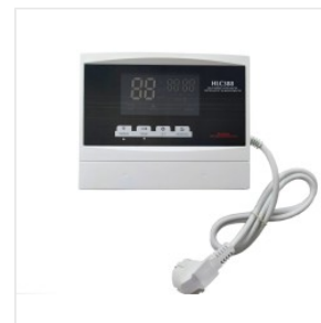
Kontroler HLC-388 175,00 PLN