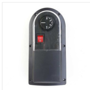
Termostat zewnętrzny 85,00 PLN