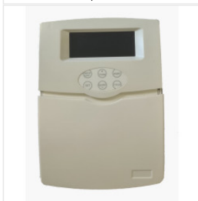
Kontroler TK-5a WiFi 250,00 PLN