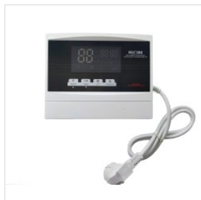
Kontroler HLC-388 175,00 PLN