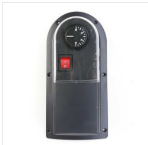
Termostat zewnętrzny 85,00 PLN