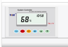
Kontroler TK-7Y 180,00 PLN