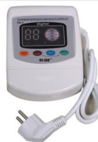
Kontroler TK-7 180,00 PLN