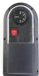
Termostat zewnętrzny 85,00 PLN