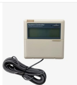
Kontroler SR81 450,00 PLN