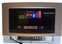
Kontroler Prophet... 180,00 PLN