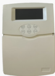
Kontroler TK-5a WiFi 250,00 PLN