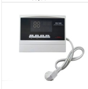
Kontroler HLC-388 175,00 PLN