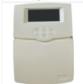
Kontroler TK-5a d... 140,00 PLN