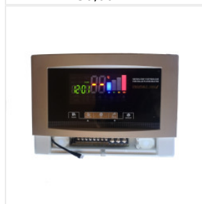
Kontroler Prophet... 180,00 PLN