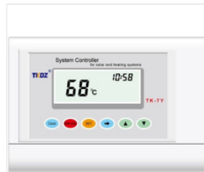
TK 7Y Regler 180,00 PLN