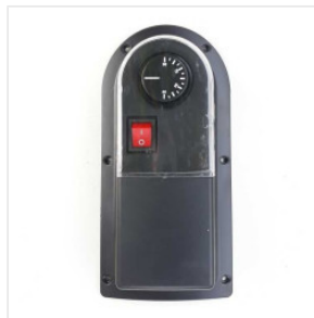
Externer Thermost... 85,00 PLN