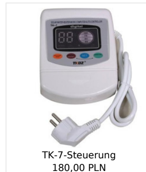
TK-7-Steuerung 180,00 PLN