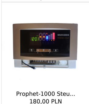
Prophet-1000 Steu... 180,00 PLN