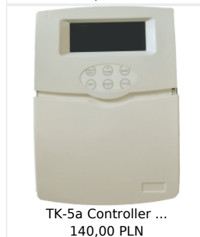
TK-5a Controller ... 140,00 PLN