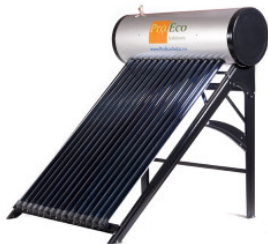
Podgrzewacz PROEC... 2 137,50 PLN