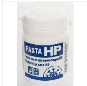
Pasta termoprzewo... 37,00 PLN