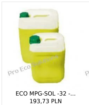
ECO MPG-SOL -32 -... 193,73 PLN