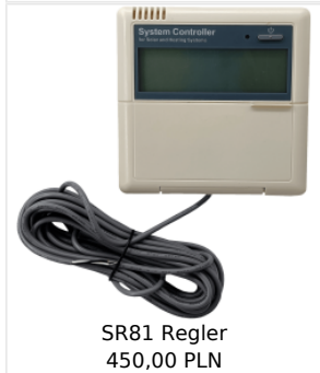
SR81 Regler 450,00 PLN