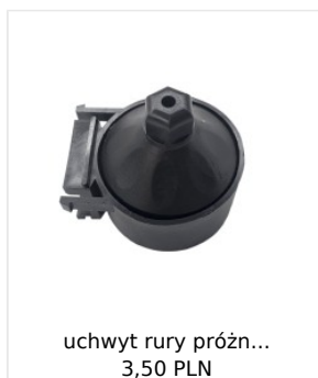
uchwyt rury próżn... 3,50 PLN