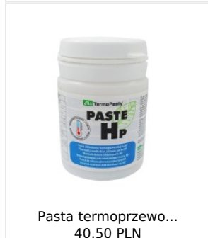
Pasta termoprzewo... 40,50 PLN