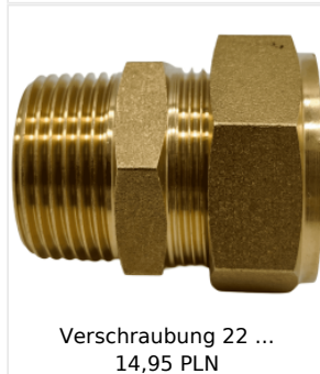
Verschraubung 22 ... 14,95 PLN