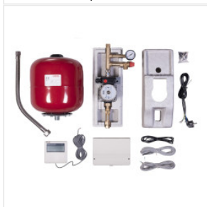
Stacja Solarna (z... 2 100,00 PLN