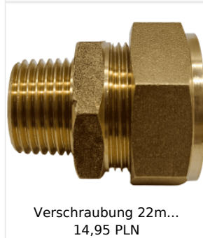
Verschraubung 22m... 14,95 PLN