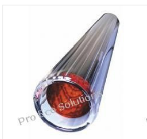
Rura próżniowa 58... 48,00 PLN