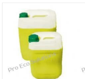
Płyn ECO MPG-SOL ... 193,73 PLN