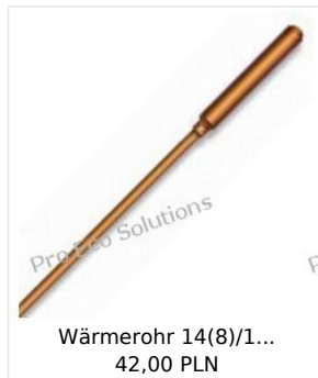
Wärmerohr 14(8)/1... 42,00 PLN