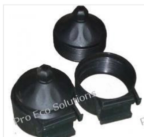
uchwyt rury próżn... 3,50 PLN