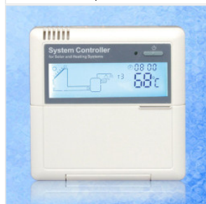
Kontroler SR81/SR... 450,00 PLN