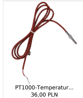
PT1000-Temperatur... 36,00 PLN