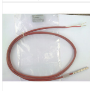
Czujnik temperatu... 36,00 PLN