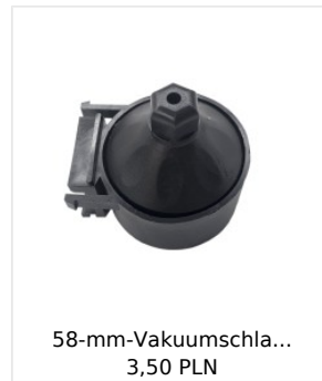
58-mm-Vakuumschla... 3,50 PLN