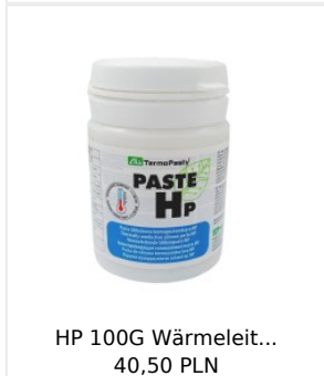
HP 100G Wärmeleit... 40,50 PLN