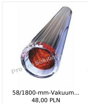
58/1800-mm-Vakuu... 48,00 PLN