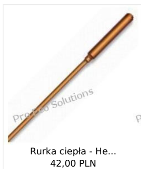
Rurka ciepła - He... 42,00 PLN