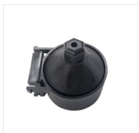
uchwyt rury próżn... 3,50 PLN