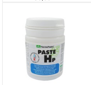
Pasta termoprzewo... 40,50 PLN