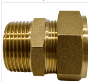
Złączka skręcana ... 14,95 PLN