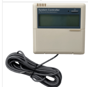
Kontroler SR81 450,00 PLN