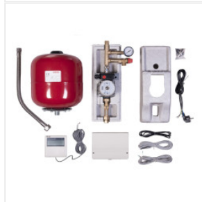
Stacja Solarna (z... 2 100,00 PLN