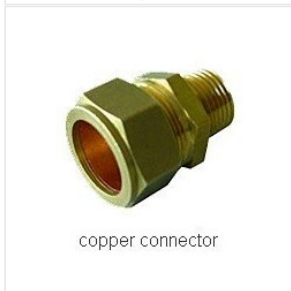
złączka skręcana ... 14,95 PLN