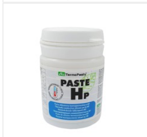
Pasta termoprzewo... 40,50 PLN