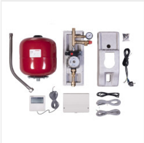
Stazione Solare (... 2.100,00 PLN