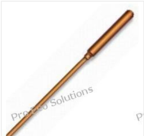
Tubo di calore - ... 42,00 PLN