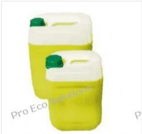
Liquido ECO MPG-S... 193,73 PLN