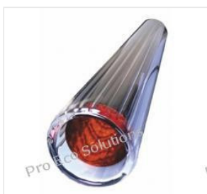
Rura próżniowa 58... 48,00 PLN