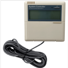
Controller SR868C... 450,00 PLN