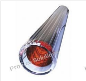
Tubo a vuoto 58/1... 48,00 PLN