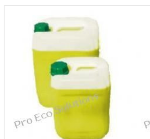
Płyn ECO MPG-SOL ... 193,73 PLN