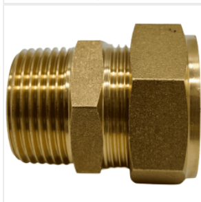
Złączka skręcana ... 14,95 PLN