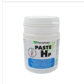
Pasta termoprzewo... 40,50 PLN