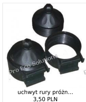
uchwyt rury próżn... 3,50 PLN