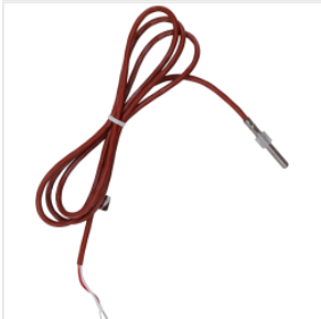
Sensore della tem... 36,00 PLN