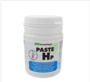
Pasta termocondut... 40,50 PLN