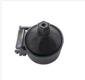
manico del tubo d... 3,50 PLN