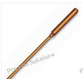
Rurka ciepła - He... 42,00 PLN