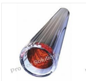
Rura próżniowa 58... 48,00 PLN