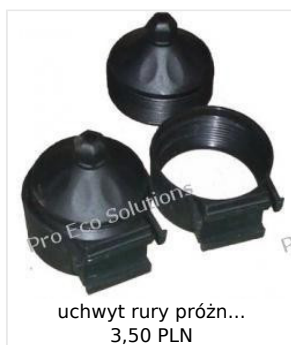
uchwyt rury próżn... 3,50 PLN