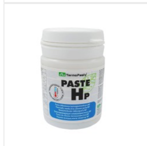
Pasta termoprzewo... 40,50 PLN