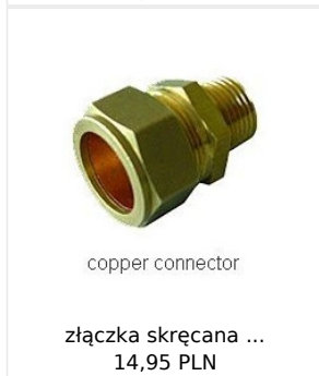
copper connector złączka skręcana ... 14,95 PLN