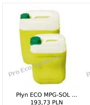
Płyn ECO MPG-SOL ... 193,73 PLN