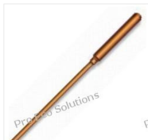
Rurka ciepła - He... 42,00 PLN