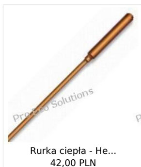
Rurka ciepła - He... 42,00 PLN