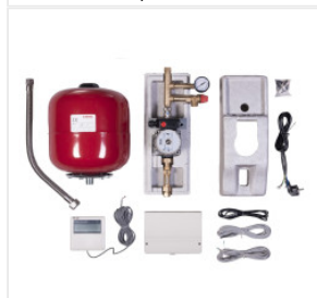
Stacja Solarna (z... 2 100,00 PLN