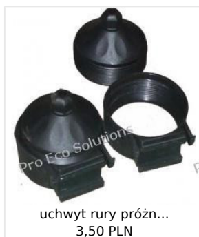
uchwyt rury próżn... 3,50 PLN