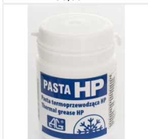
Pasta termoprzewo... 40,50 PLN