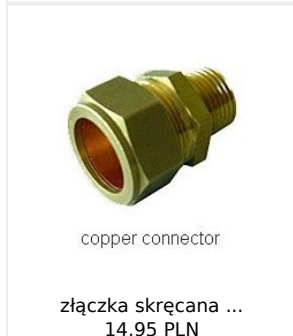
copper connector złączka skręcana ... 14,95 PLN