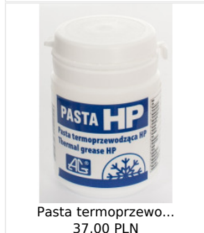
Pasta termoprzewo... 37,00 PLN