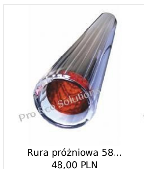
Rura próżniowa 58... 48,00 PLN