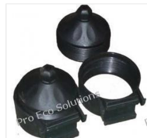
uchwyt rury próżn... 3,50 PLN