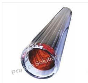
Rura próżniowa 58... 48,00 PLN