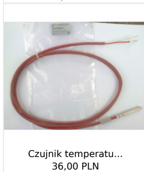
Czujnik temperatu... 36,00 PLN