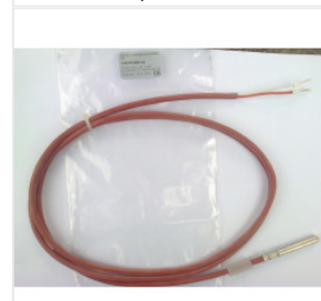
Czujnik temperatu... 36,00 PLN