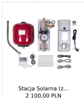
Stacja Solarna (z... 2 100,00 PLN