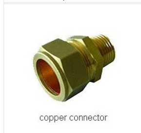
złączka skręcana ... 14,95 PLN