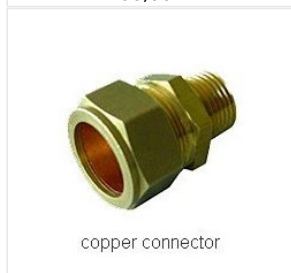
złączka skręcana ... 14,95 PLN