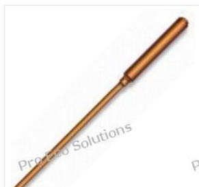
Rurka ciepła - He... 42,00 PLN