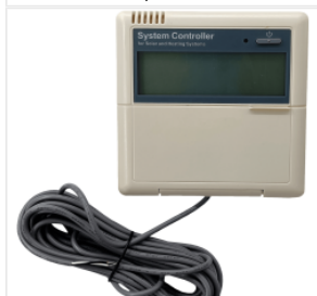
Kontroler SR81 450,00 PLN