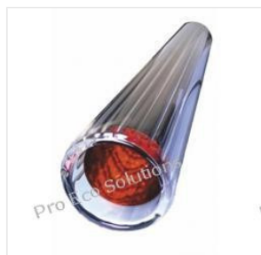
Rura próżniowa 58... 48,00 PLN