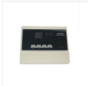
Kontroler HLC-388 175,00 PLN