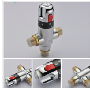
Termostatyczny za... 205,00 PLN