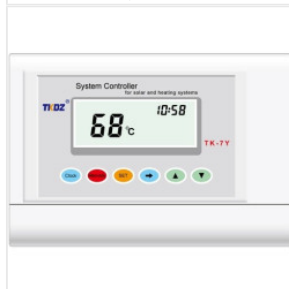
Kontroler TK-7Y 180,00 PLN