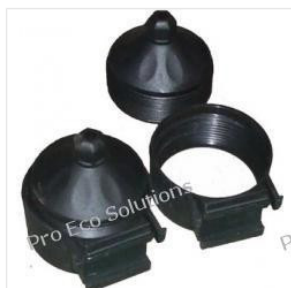
uchwyt rury próżn... 3,50 PLN