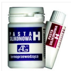
Pasta Termoprzewo... 15,82 PLN