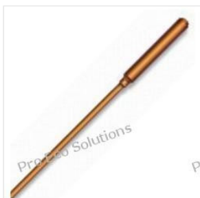
Rurka ciepła - He... 42,00 PLN