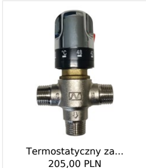
Termostatyczny za... 205,00 PLN