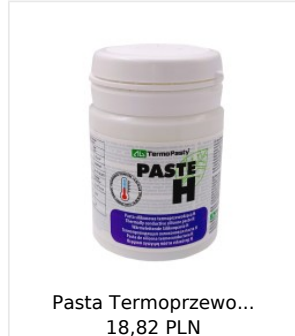
Pasta Termoprzewo... 18,82 PLN