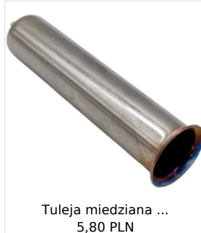
Tuleja miedziana ... 5,80 PLN