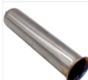
Tuleja miedziana ... 5,80 PLN