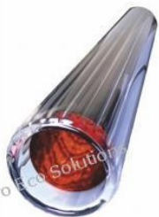
Rura próżniowa 58... 48,00 PLN