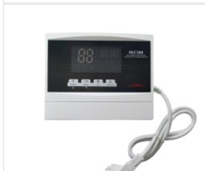
Kontroler HLC-388 175,00 PLN