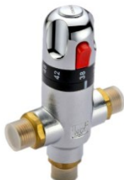
Termostatyczny za... 205,00 PLN