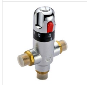
Termostatyczny za... 205,00 PLN