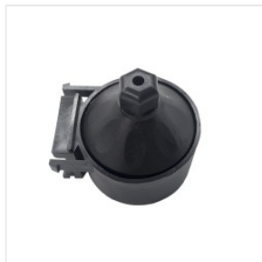
uchwyt rury próżn... 3,50 PLN