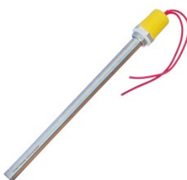
Grzałka elektrycz... 57,00 PLN