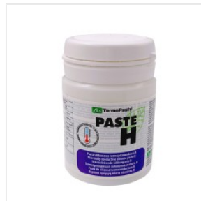
Pasta Termoprzewo... 18,82 PLN