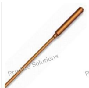
Rurka ciepła - He... 42,00 PLN