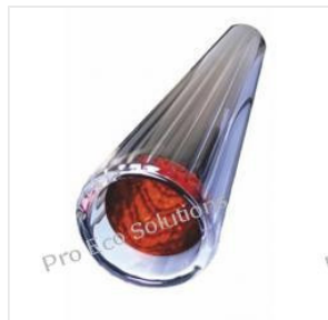
Rura próżniowa 58... 48,00 PLN