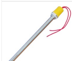
Grzałka elektrycz... 57,00 PLN