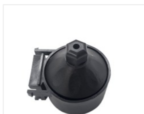
uchwyt rury próżn... 3,50 PLN