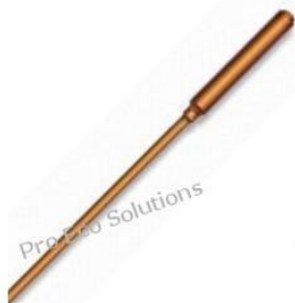
Rurka ciepła - He... 42,00 PLN