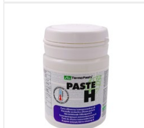
Pasta Termoprzewo... 18,82 PLN