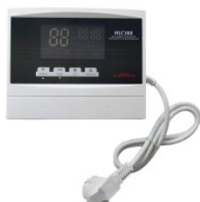
Kontroler HLC-388 175,00 PLN