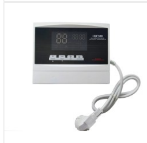
Kontroler HLC-388 175,00 PLN