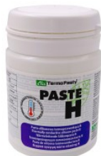
Pasta Termoprzewo... 18,82 PLN