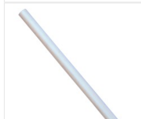
Anoda Magnezowa 3... 28,00 PLN