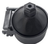
uchwyt rury próżn... 3,50 PLN