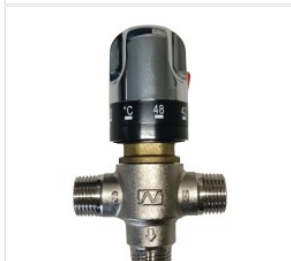
Termostatyczny za... 205,00 PLN