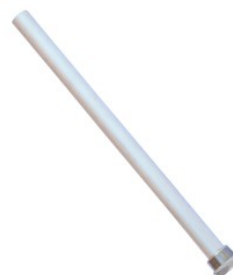
Anoda Magnezowa 3... 28,00 PLN