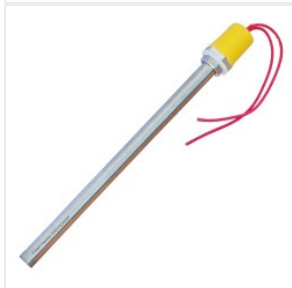
Grzałka elektrycz... 79,50 PLN