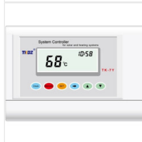
Kontroler TK-7Y 180,00 PLN