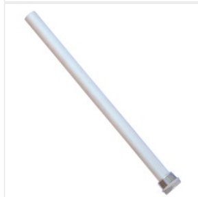
Anoda Magnezowa 3... 29,00 PLN