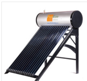
Podgrzewacz PROEC... 2 850,00 PLN