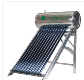
Podgrzewacz PROEC... 3 150,00 PLN