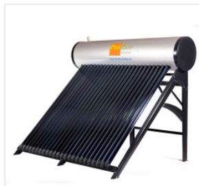
Podgrzewacz PROEC... 4 500,00 PLN