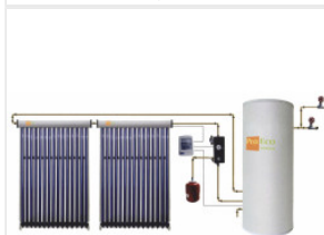
Zestaw PROECO CY-150 8 200,00 PLN