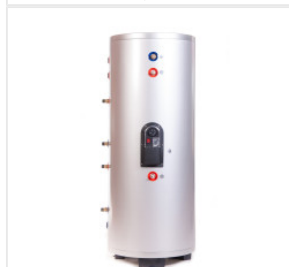
Zasobnik 150 l. z... 3 400,00 PLN