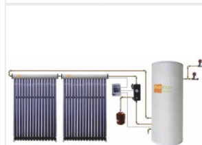
Zestaw PROECO CY-300 12 100,00 PLN