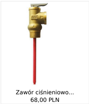
Zawór ciśnieniowo... 68,00 PLN