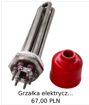
Grzałka elektrycz... 67,00 PLN