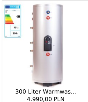
300-Liter-Warmwas... 4.990,00 PLN