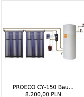
PROECO CY-150 Bau... 8.200,00 PLN