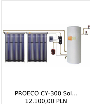
PROECO CY-300 Sol... 12.100,00 PLN