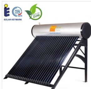
Solar Druck-Boile... 2.999,00 PLN