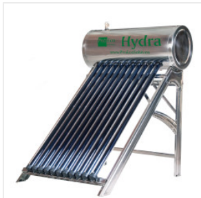
Solar Druck-boile... 1.999,00 PLN