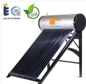
Solar Druck-boile... 2.249,00 PLN