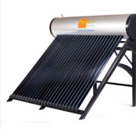
Podgrzewacz PROEC... 4 500,00 PLN