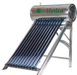
Podgrzewacz PROEC... 3 150,00 PLN