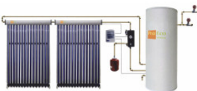
Zestaw PROECO CY-150 8 200,00 PLN