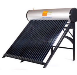
Podgrzewacz PROEC... 3 600,00 PLN